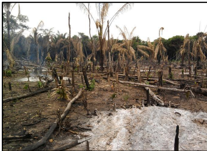
Roça de toco.

Por exemplo, em uma aldeia, os espaços construídos pelos povos alteram a paisagem natural. Podemos citar as casas, espaços do sagrado, espaços de convivência, o pátio, campo de futebol, as roças, lugares onde se faz farinha, onde se preparam alimentos, dentre outros.