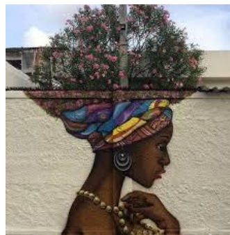
A luta pela sobrevivência: o desafio de ser mulher negra no Brasil

A voz de minha filha recolhe em si a fala e o ato. O ontem – o hoje – o agora. Na voz de minha filha se fará ouvir a ressonância O eco da vida-liberdade.