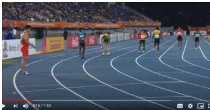
Figura 3: Corrida de Revezamento.