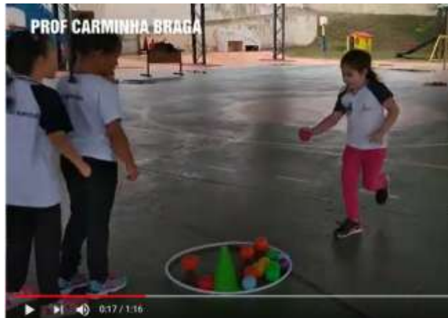
Figura 2: Jogo Esporte.