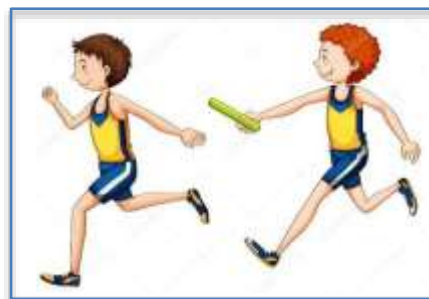
Figura 1. Corrida de Revezamento

Existe ainda no atletismo uma corrida muito conhecida por todos, que se chama CORRIDA DE REVEZAMENTO ou 4x100m. É a única prova coletiva de atletismo, na qual quatro atletas da mesma equipe se revezam e correm 100 metros cada, passando o bastão para o amigo, tentando percorrer a pista no menor tempo possível.