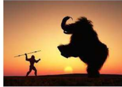
Primata caçando um mamute com lança (refere-se ao lançamento de dardo do atletismo)

Você sabia que o atletismo é a prática esportiva mais antiga já praticada pelo ser humano? Para sobreviver na Pré-história, o homem já praticava diversos movimentos como correr, saltar, lançar e arremessar. Podemos destacar que foi por meio dessas possibilidades de se movimentar que o ser humano desenvolveu várias habilidades no decorrer da História.