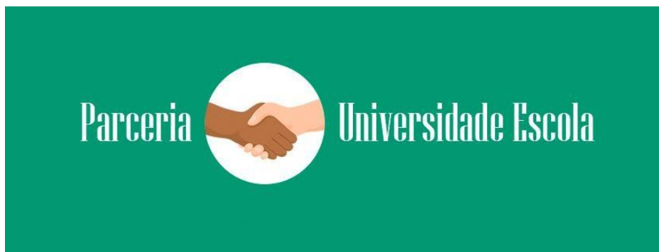
Figura 5. Parceria

As parcerias também ocorrem entre estudantes e professores na própria escola. Ao se sentirem prestigiados, educandos e educadores podem sonhar e realizar mais! As parcerias com universidades também representam um grande potencial para as escolas.