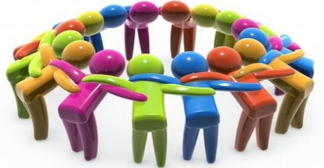
Figura 3. Jovem

Com o grêmio estudantil vocês podem se unirem ainda mais em prol dos estudantes e de sua escola, podem também desenvolver ações articuladas com outras escolas, trocar experiências e benfeitorias em prol de seu bairro e até mesmo cidade, sociedade de modo geral.