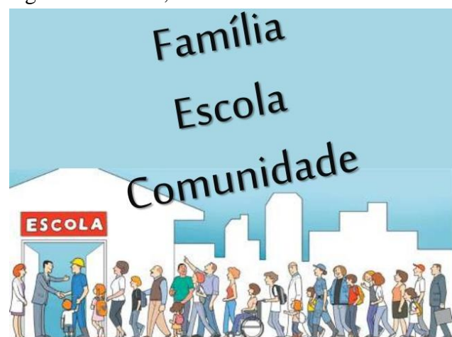
Figura 4. Família, escola e comunidade