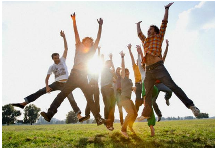
Figura 2. Jovem

Que escola você quer? Quais são seus sonhos? Quais são seus projetos de vida? As respostas a estas perguntas podem ajudar os estudantes, os profissionais da educação, escolas e governos a realizarem atividades pertinentes aos desejos expressos dos estudantes.