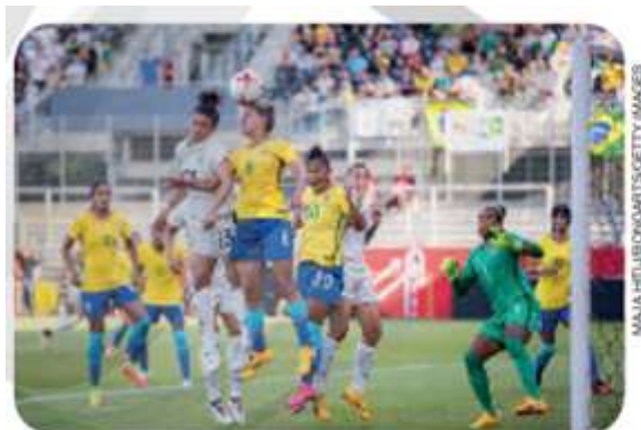
Jogo de futebol. Alemanha e Brasil, na Alemanha, em 2017.