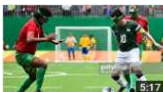
Figura 7 - Jogo paralímpico

Assista uma parte de uma partida de futebol do Jogos Paralímpicos - Futebol de 5 - Brasil x China.