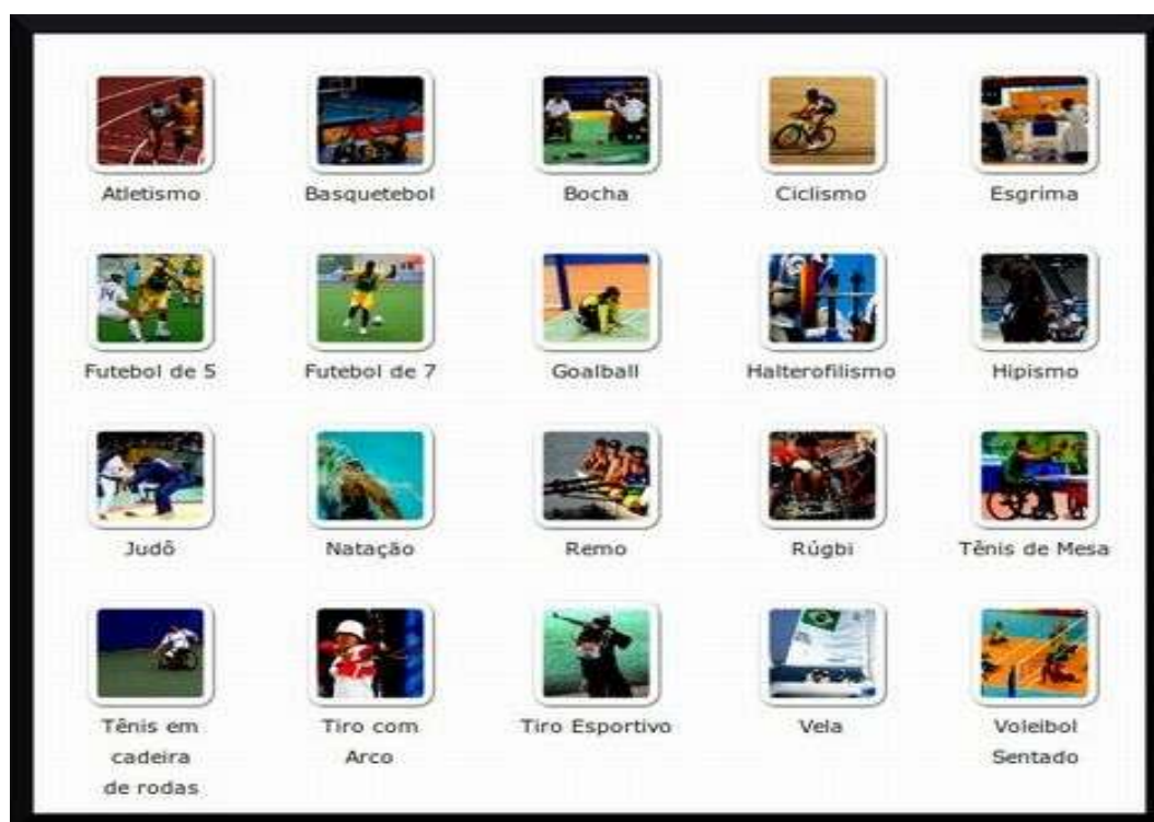
Figura 5 - Esportes

Todos os esportes listados abaixo participam das Olimpíadas Paraolímpicas. Aponte quais destes são classificados como esportes de invasão.