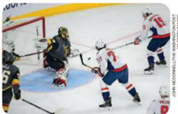
Jogo de hóquei no gelo. Washington Capitals e Vegas Golden Knights, nos Estados Unidos, em 2018.