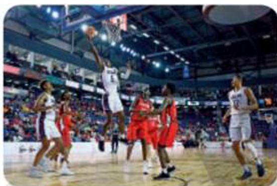
Jogo de basquetebol. Canadá e Estados Unidos, no Canadá, em 2018.