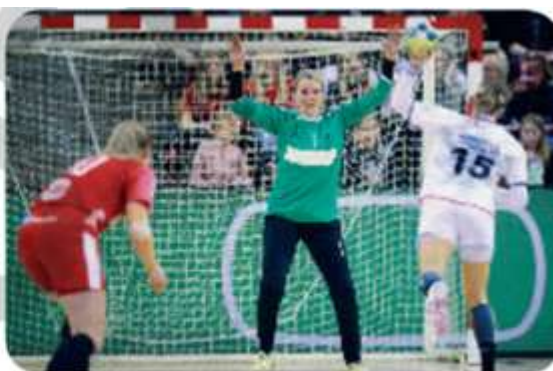
Jogo de handebol. Dinamarca e República Tcheca, na Dinamarca, em 2018.